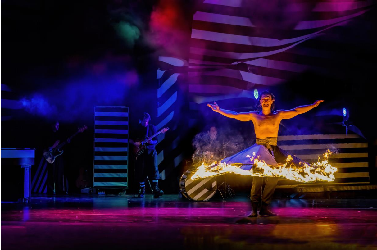
BEELD JAAP REEDIJK